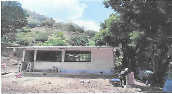
Foto1: Cernido de Pared